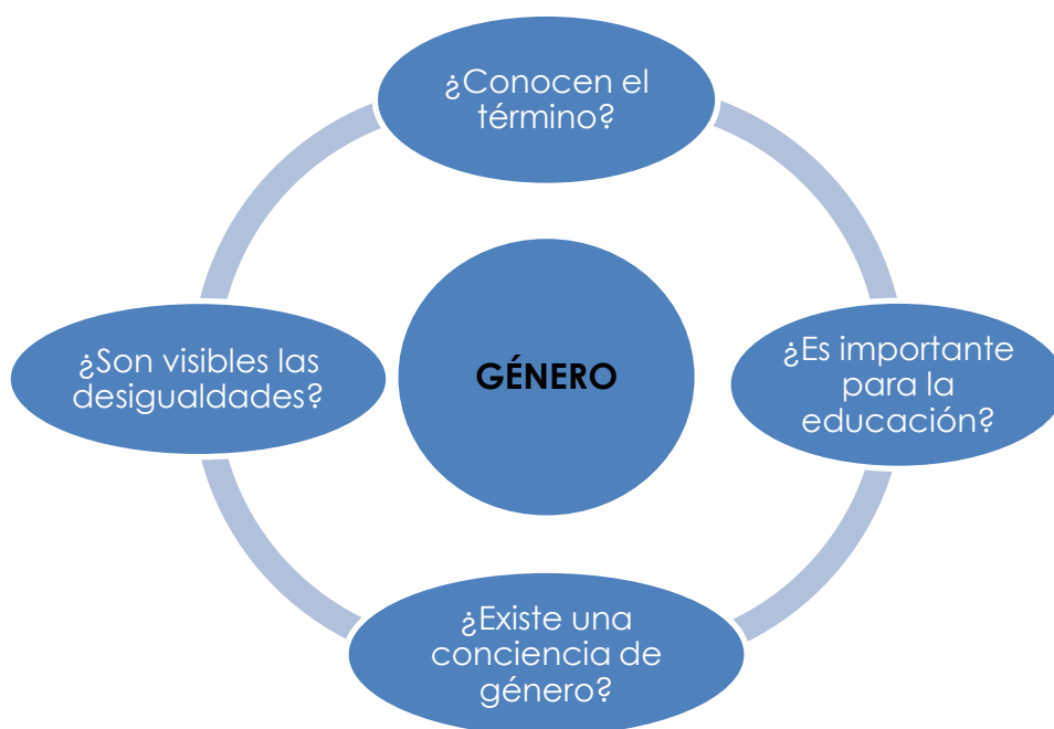
Figura 5. Categoría: Género.

5.- Género. Es la principal categoría de análisis en esta investigación. Por la relevancia de este concepto, he contemplado un apartado específico, si bien está presente de forma transversal en el resto de las categorías. Se trata de saber si el término se conoce y si es considerado importante en la socialización. Me interesa analizar por un lado, si existe una conciencia de género y por otro, si las desigualdades son visibles o no para las familias.