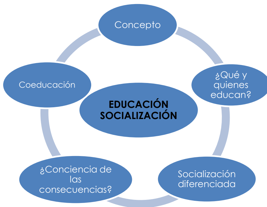
Figura 3. Categoría: Educación y la Socialización Diferenciada.

4.- La Familia . Las transformaciones sociales han provocado un cambio en lo que tradicionalmente se entendía por familia. En esta categoría analizo el concepto de familia desde su diversidad y el valor que esta tiene como principal agente socializante.