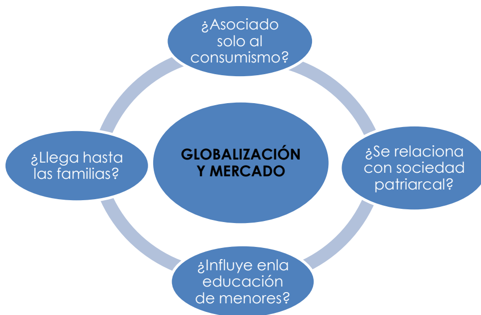
Figura 2. Categoría: Globalización y la Sociedad de Mercado.

2.- La Globalización y la sociedad de mercado. Como fenómeno universal, me interesaba analizar qué percepción se tiene de este fenómeno, si piensan que llega a calar en las familias y si está relacionado con el sistema patriarcal.