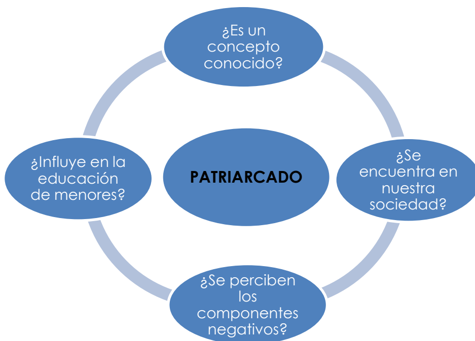
Figura 1. Categoría: Sistema Patriarcal.

1.- Sociedad Patriarcal . Este sistema se encuentra estrechamente asociada, por un lado, a una situación ya pasada, es decir a sociedades antiguas, y por otro, al mero hecho de que en los estamentos sociales haya mucha más representación masculina que femenina. La investigación pretende indagar si el concepto es conocido más allá de la mera representación masculina y si hay conciencia de su presencia en nuestra sociedad. Igualmente, conocer la incidencia que de aquí se desprende en las familias.